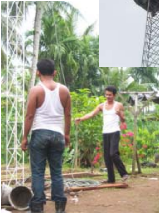
Ketika pemasangan tower internet