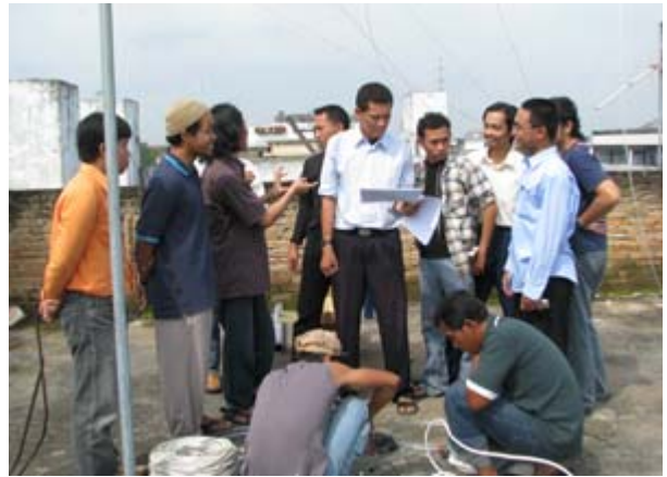
Setelah pemasangan tower internet, dilakukan juga pemasangan radio internet point to point

sekaligus memasang wireless access di rumah-rumah masyarakat yang berkeinginan menggunakan internet.