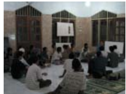
Masyarakat Kampung Terang Bulan rapat membahas kemungkinan daerahnya bisa terakses internet.