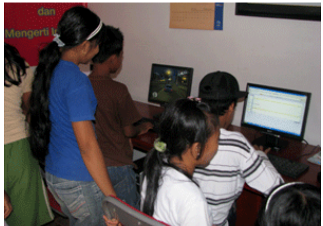
Anak-anak Kampung Terang Bulan kini sudah bisa memakai internet dan membuat blog sendiri.