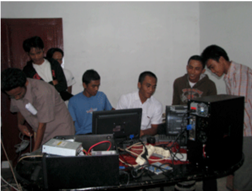
Pelatihan komputer dan internet yang dilakukan untuk masyarakat Kampung Terang Bulan

pemuda dari kampung-kampung tetangga seperti kampung Payabakung, Diski, Penampungan, Pasar 4, dan Gg. Gembira," ujar Ridho.